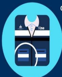
Logo ONE + Gobierno Dominicano + Censo