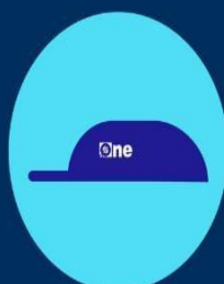
Logo ONE + Gobierno Dominicano + Censo