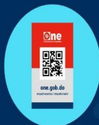
Carnet con rol + Código QR